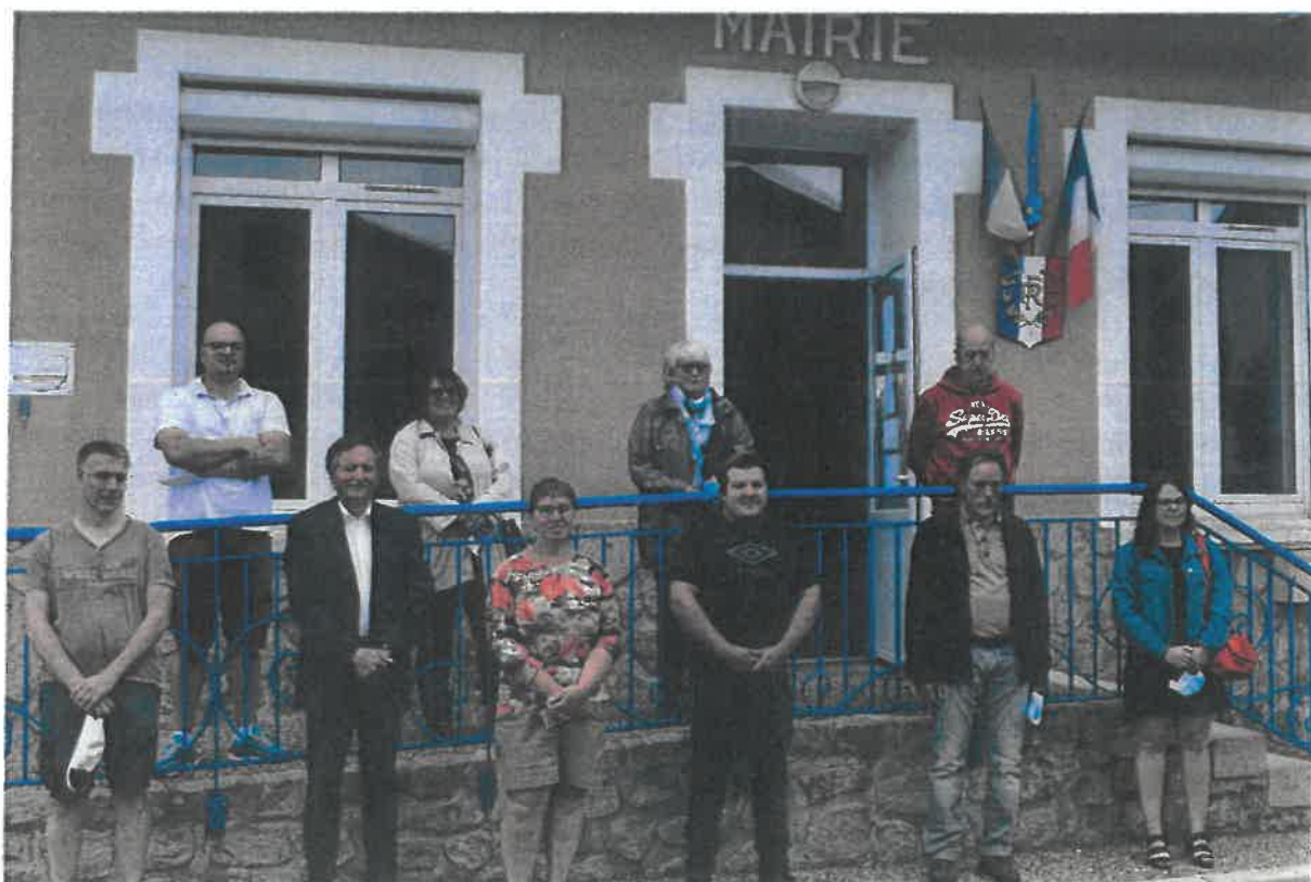
Le conseil municipal de Sembadel 2020-2026 :