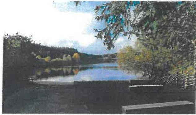
PNR Livradois-Forez et Atelier Bivouac