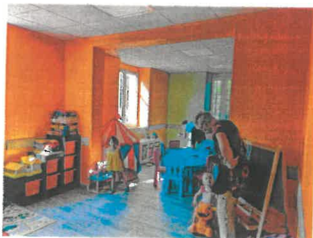
MAM « La gare des p'tits loups »