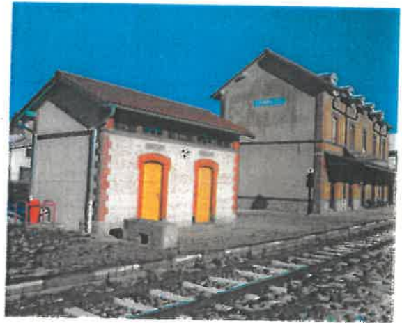
WC La gare