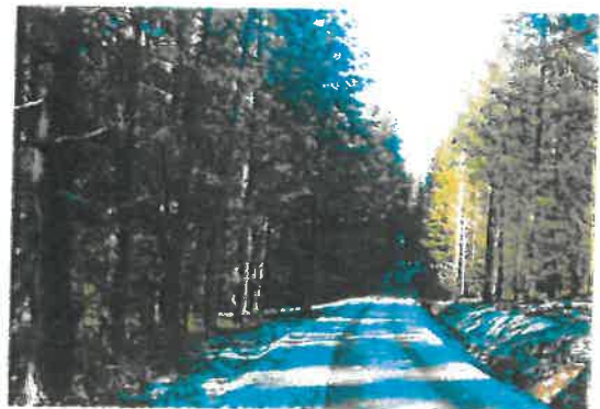
PISTE FORESTIERE DIGNAC