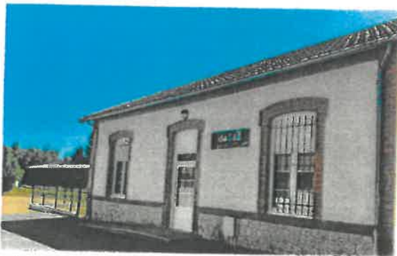
MAM « La gare des p'tits loups »