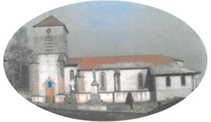
Durant les années 1980