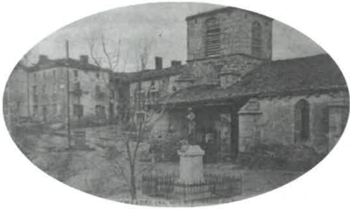
Durant les années 1920