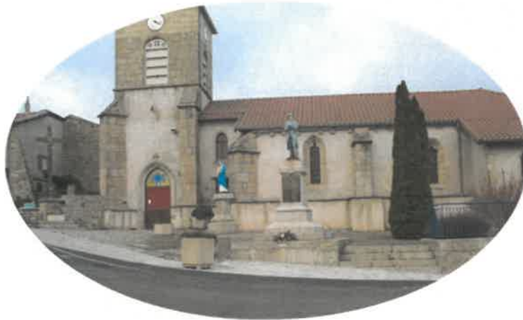
De nos jours